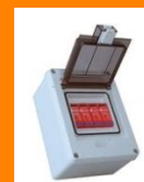
SISTEMAS DE PROTECCIÓN