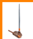
PARARRAYOS JAULA DE FARADAY