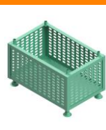
TRANSPORTE Y ALMACENAJE