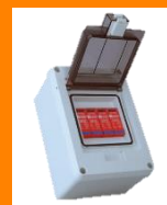
PROTECCIÓN Vs. SOBRETENSIONES