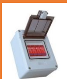
SISTEMAS DE PROTECCIÓN