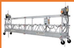
ANDAMIOS COLGANTES ELÉCTRICOS