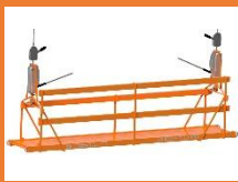
ANDAMIOS COLGANTES MECÁNICOS