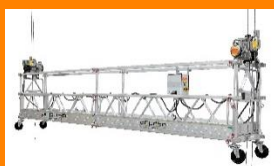
Andamios colgantes eléctricos