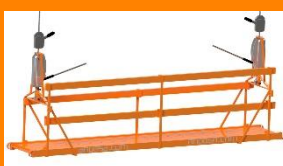
Andamios colgantes mecánicos