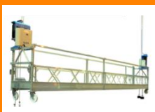
Andamios colgantes eléctricos

* Para mayor información sobre la gama completa de componentes y nuestros servicios de instalación y mantenimiento, comuníquese con nosotros