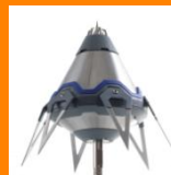
Pararrayos PDC Prevectorn 3°