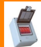
Protección Vs. Sobretensiones