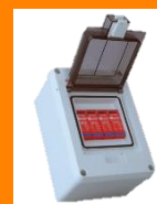
PROTECCIÓN Vs. SOBRE TENSIONES