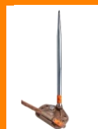
PARARRAYOS JAULA DE FARADAY